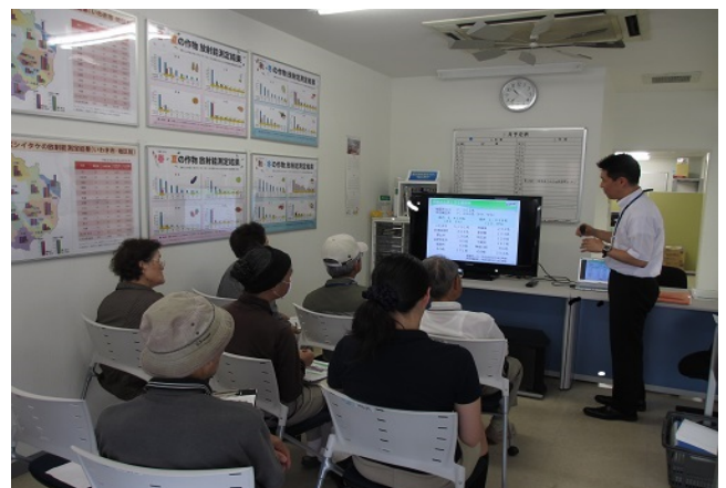
第24回ミニ相談会の様子