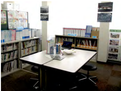
<震災アーカイブ室の様子>