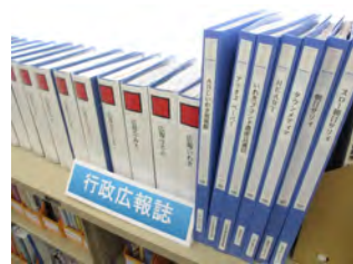
<行政広報誌> 政府や行政が発行する刊行物等（各市町村の報告書等）