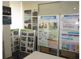
<パネル展示> 収集写真や、当事業の取り組み等について取りまとめたパネルを展示