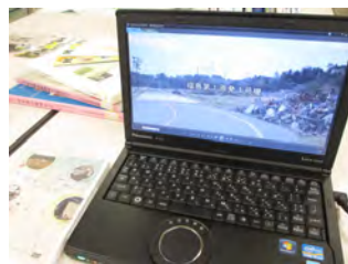
<DVD映像視聴> 映像資料は、その場で視聴いただくことが出来ます