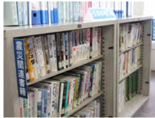
<震災関連書籍> 震災関連の発売書籍ならびに各民間団体発行誌等