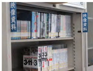
<映像資料> 震災の様子を収めた写真集や震災関連動画・自主制作映画DVD等