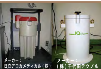
メーカー: 日立アロカメディカル(株) (株)千代田テクノ