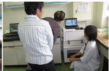
＜検査見学のようす＞