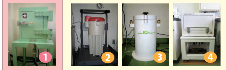
＜各種放射能検査装置による測定結果＞

非破壊式検査装置は、検体を細かく刻む必要がなく専用容器も不要です。また大きな検出器が4つ搭載されており、短時間で測定することが出来ます。測定結果を比較してみると、精密測定用検査器と大きな差異なく測定可能であることがわかります。