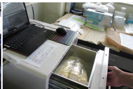
＜非破壊式検査のようす＞