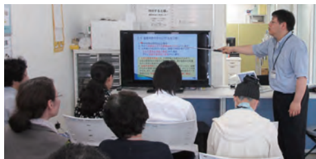
ミニ相談会のようす